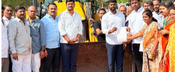
..నాగారం డివిజన్ లో రూ. 55 లక్షలతో నిర్మించిన సిసి రోడ్ ప్రారంభం