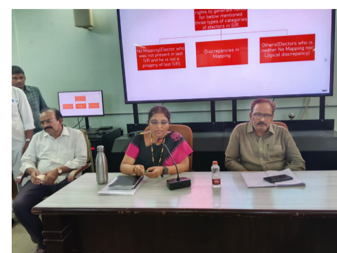
కార్యక్రమంలో సూపర్వైజర్లు బిఎల్ఏలు సంబంధిత అధికారులు పట్టణ టీడీపీ నాయకులు పాల్గొన్నారు.