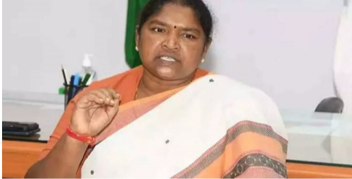
చేశారు. వ్యక్తీత భూ అభివృద్ధి పనులను తొలగిస్తే చిన్న రైతులకు నష్టమని చెప్పారు.