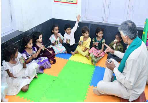
సమక్షంలోనే రాగి జావ తయారు చేశారు. చంద్రబాబు చిన్నారులతో కలిసి కింద కూర్చుని ఆ జావను స్వీకరించారు. ఆయన చర్మ అక్కయ్యను చూసి ఆకట్టుకుంది. పర్మనెంట్ భాగంగా పప్పుదాన్ని ప్రోత్సహిస్తూ అంగన్వాడీ ప్రాంగణంలో సిబ్బందితో కలిసి మొక్క