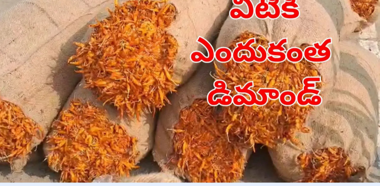
పటక ఎండుకంత డిమాండ్