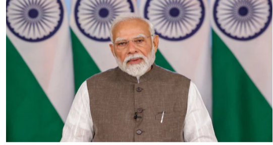
ప్రధాని పేర్కొన్నారు. ఇటీవల గట్ పర్లా ఉత్పాదలు ఘనంగా జరిగాయని, ఇప్పుడు జగన్మోహన్ రథయత్రాకు ఏర్పాటు జోరుగా సాగుతున్నాయని చెప్పారు. మయూరభంజిలో జరిగి జారిపడ రథయాత్రపై కూడా ప్రజల్లో ఉత్సాహం కనిపిస్తోందన్నారు. ఈ పండుగల వాతావరణంలోనే అభివృద్ధి, ప్రజాస్వామ్య ఉత్పన్నం కూడా కొనసాగుతోందని వ్యాఖ్యానించారు.

గిరిజన యువతకు అవకాశాలు గిరిజన సహజ అభివృద్ధి కేంద్ర ప్రభుత్వ ప్రాధాన్య అంశమని ప్రధాని స్పష్టం చేశారు. గిరిజన యువతకు మెరుగైన విద్య, ఉపాధి అవకాశాలు కల్పించేందుకు చర్యలు తీసుకుంటున్నామని చెప్పారు. దేశవ్యాప్తంగా సుమారు 500 ఏకలక్ష మోడల్ రెసిడెన్షియల్ పాఠశాలలను ఏర్పాటు చేశామని తెలిపారు. ఈ విద్యార్థిసంఖ్య గిరిజన విద్యార్థుల భవిష్యత్తును మార్చే దిశగా పనిచేస్తున్నాయని పేర్కొన్నారు. మయూరభంజిలో ప్రత్యేక అనుబంధం మయూరభంజిలో ప్రజలతో తనకు ప్రత్యేక అనుబంధం ఉందని ప్రధాని అన్నారు. ప్రజలు చూపుతున్న ప్రేమాభిమానాలే తనను పడేదే ఈ ప్రాంతానికి రహస్యమని చెప్పారు. ఓడిశాలో ఓడికే ప్రభుత్వం రెండేళ్లు పూర్తి చేసుకున్న ఈ సందర్భంగా ప్రజల మధ్యకు రావడం తనకు ప్రత్యేక అనుభూతినిచ్చిందన్నారు. పండుగల సందడిలో అభివృద్ధి చేసే దిశగా ప్రస్తుతం ఓడిశా పండుగల సందరిలో మునిగిపోయిందని